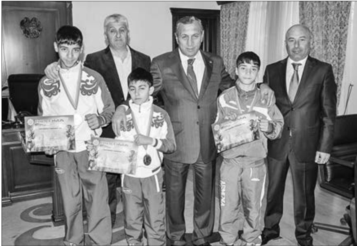
Եվրոպայի չեմպիոնների ընդունելությունը մարզպետարանում