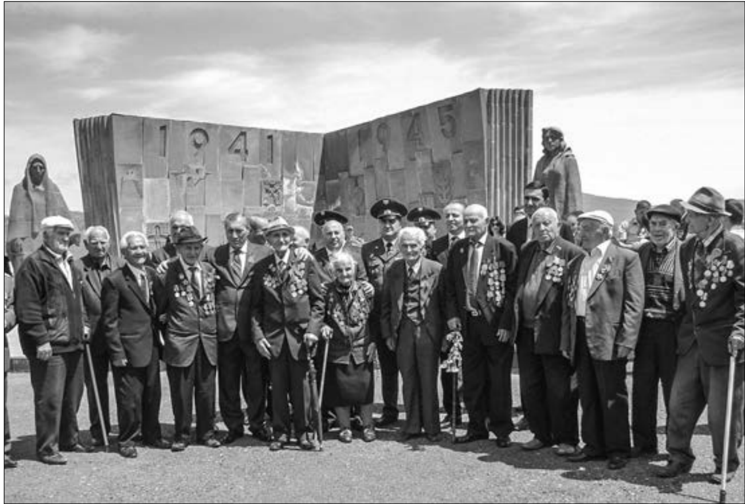
9 մայիսի 2015թ., Կապան

Հայրենիքի զինվոր եղե՛ք, հայրենիքին մասադ... ՍԵՐՈ ԽԱՆՉԱԴՅԱՆ